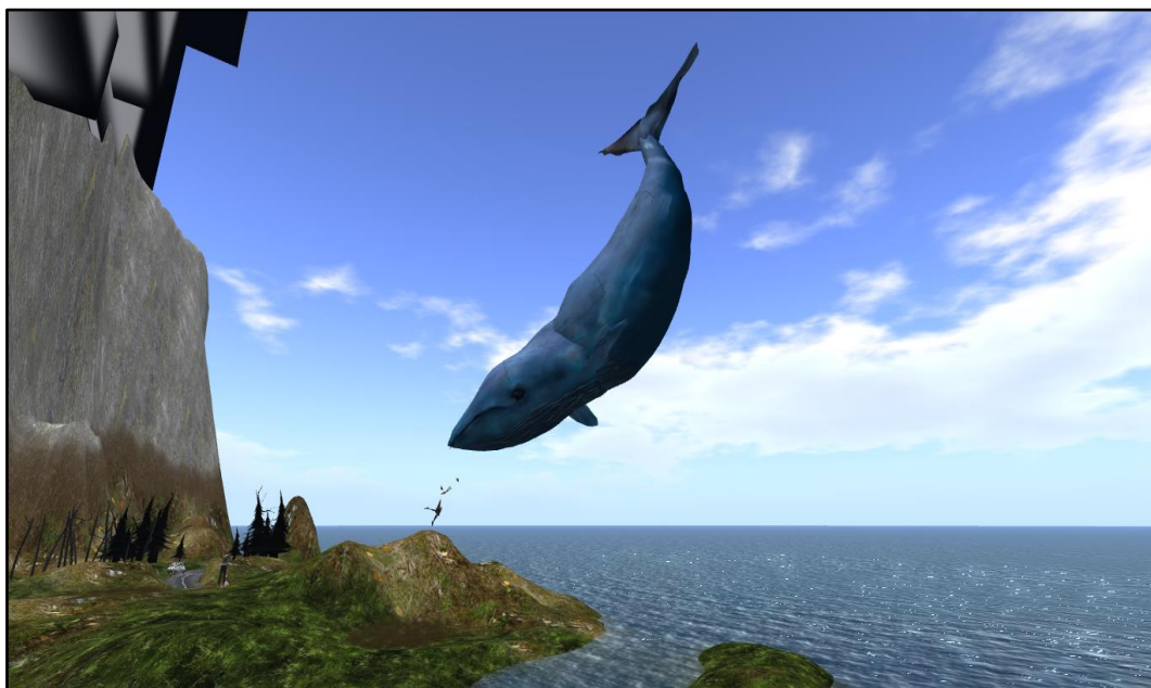
Foto 1. Bryn Oh. Particolare dell'installazione Imogen and the pigeons

Il mondo virtuale offre all'artista la possibilità di estendere al massimo la propria creatività e, utilizzando lo spazio a tutto tondo come se fosse un ambiente fisico tridimensionale, di dare al contempo pieno sfogo alla propria immaginazione. Nel mondo virtuale, infatti, a differenza della realtà fisica, l'artista può esprimersi con totale libertà, non essendo vincolato da limiti di spazio, peso, dimensione. La foto